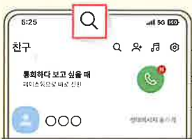
1 카카오톡에서 🔍 선택