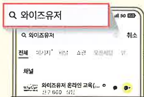
2 상단 검색창에 '와이즈유저' 검색